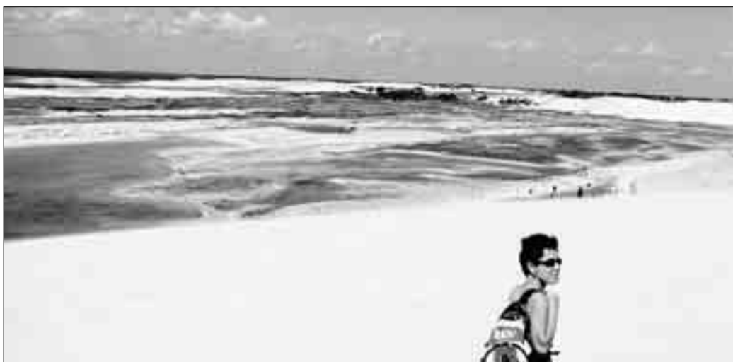
DIVERTIMENTO E SOLIDARIETÀ. Le dune di Tatajuba, una delle mete del tour

Il viaggio di Tremembè, il primo organizzato dall'associazione, prevede una quota di partecipazione di 1750 euro e comprende il volo di andata e ritorno Milano - Fortaleza, trasferimenti interni in furgone topik e sistemazione nelle diverse strutture ricettive in pensione completa. Il viaggio offre moltissimi spunti di interesse e visite anche ad alcune progetti portati avanti dall'associazione stessa. Il secondo giorno, ad esempio, è previsto l'arrivo a Batoque, a 50 chilometri da Fortaleza, l'unica riserva naturale dello stato del Cearà. Si tratta di un'area protetta dove però è in corso una gran-