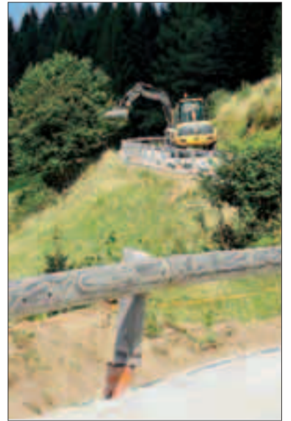
Lavori in corso