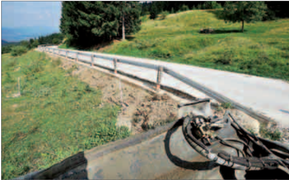
Il tratto in cui è già stratto cancellato il muretto a lato della strada per malga Brigolina